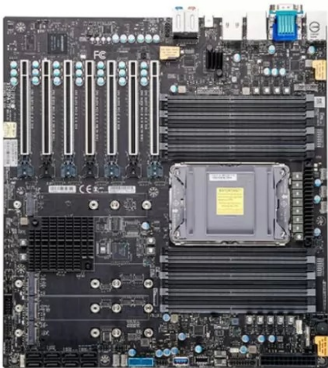
Фото Материнская плата SUPERMICRO MBD-X12SPA-TF-B E-ATX, LGA4189, Intel C621A

Отправьте запрос на коммерческое предложение SUPERMICRO и получите индивидуальные цены и сроки поставки. Серверы 1u, 2u, рабочие станции, системы хранения данных, серверные платформы, GPU-системы, BigTwin, SuperBlade