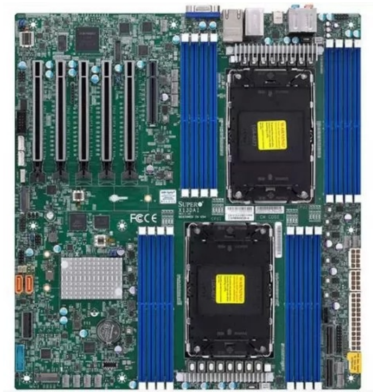
Фото Материнская плата E-ATX SUPERMICRO MBD-X13DAI-T-B для Intel C741, DDR5, 2 LGA4677, 2 M.2, 10 SATA, 6 PCIe

Отправьте запрос на коммерческое предложение SUPERMICRO и получите индивидуальные цены и сроки поставки. Серверы 1u, 2u, рабочие станции, системы хранения данных, серверные платформы, GPU-системы, BigTwin, SuperBlade