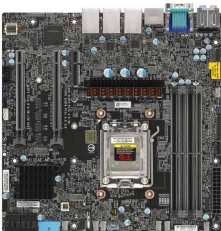
Фото Материнская плата mATX SUPERMICRO MBD-H13SAE-MF-B для AMD B650, DDR5, AM5, 2 M.2, 4 SATA, HDMI, DVI

Отправьте запрос на коммерческое предложение SUPERMICRO и получите индивидуальные цены и сроки поставки. Серверы 1u, 2u, рабочие станции, системы хранения данных, серверные платформы, GPU-системы, BigTwin, SuperBlade