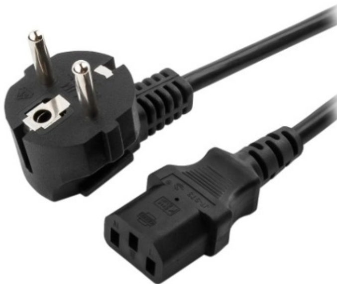
Фото SUPERMICRO CBL-PWCD-0566-IS кабель питания

Отправьте запрос на коммерческое предложение SUPERMICRO и получите индивидуальные цены и сроки поставки. Серверы 1u, 2u, рабочие станции, системы хранения данных, серверные платформы, GPU-системы, BigTwin, SuperBlade