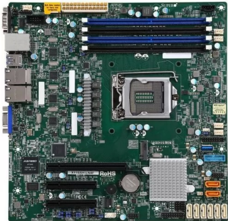
Фото Материнская плата SUPERMICRO MBD-X11SSH-LN4F-B mATX LGA1151 Intel C236

Отправьте запрос на коммерческое предложение SUPERMICRO и получите индивидуальные цены и сроки поставки. Серверы 1u, 2u, рабочие станции, системы хранения данных, серверные платформы, GPU-системы, BigTwin, SuperBlade