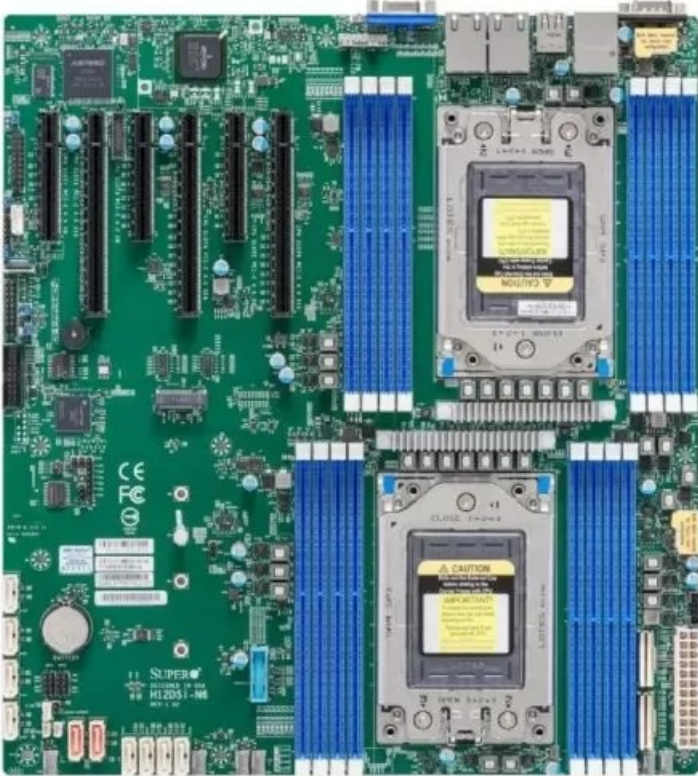
Фото Материнская плата E-ATX SUPERMICRO MBD-H12DSI-N6-B для AMD SP3

Отправьте запрос на коммерческое предложение SUPERMICRO и получите индивидуальные цены и сроки поставки. Серверы 1u, 2u, рабочие станции, системы хранения данных, серверные платформы, GPU-системы, BigTwin, SuperBlade