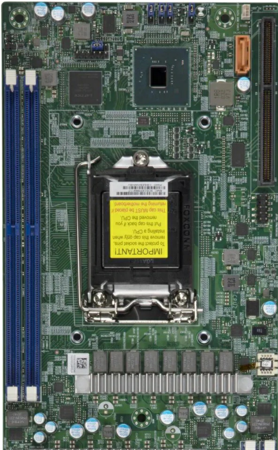
Фото Материнская плата Supermicro B2SC2-TF

Отправьте запрос на коммерческое предложение SUPERMICRO и получите индивидуальные цены и сроки поставки. Серверы 1u, 2u, рабочие станции, системы хранения данных, серверные платформы, GPU-системы, BigTwin, SuperBlade