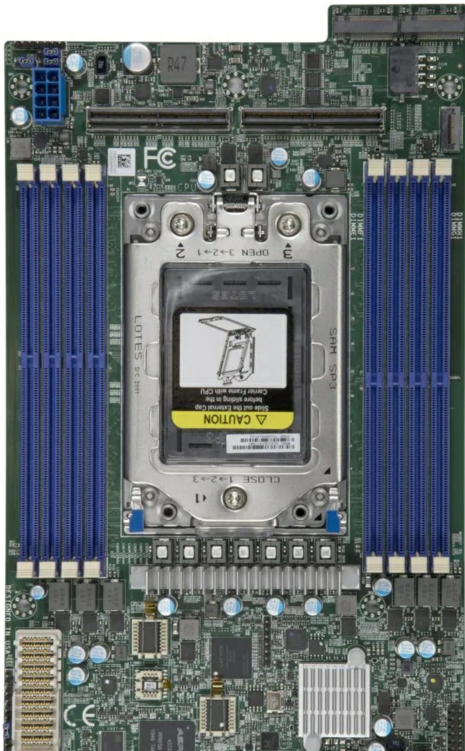
Фото Материнская плата Supermicro BH12SSi-M25

Отправьте запрос на коммерческое предложение SUPERMICRO и получите индивидуальные цены и сроки поставки. Серверы 1u, 2u, рабочие станции, системы хранения данных, серверные платформы, GPU-системы, BigTwin, SuperBlade