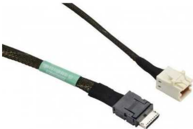
Фото Кабель SuperMicro CBL-SAST-1260-100

Отправьте запрос на коммерческое предложение SUPERMICRO и получите индивидуальные цены и сроки поставки. Серверы 1u, 2u, рабочие станции, системы хранения данных, серверные платформы, GPU-системы, BigTwin, SuperBlade