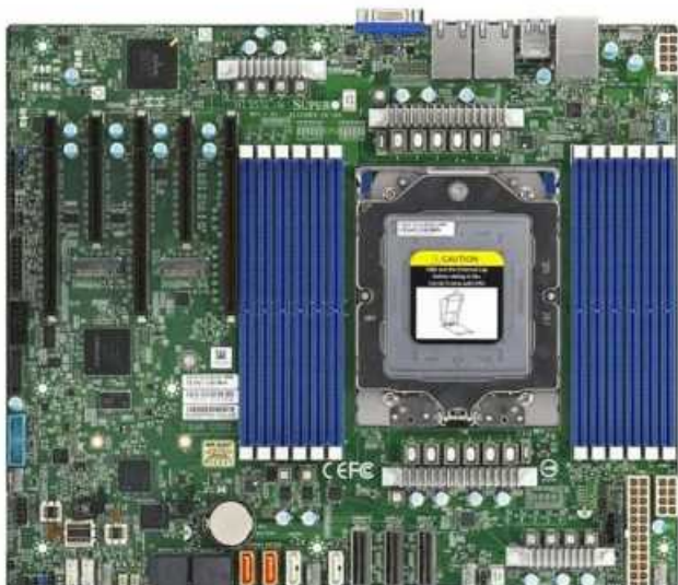
Фото Материнская плата SuperMicro MBD-H13SSL-N-O

Отправьте запрос на коммерческое предложение SUPERMICRO и получите индивидуальные цены и сроки поставки. Серверы 1u, 2u, рабочие станции, системы хранения данных, серверные платформы, GPU-системы, BigTwin, SuperBlade