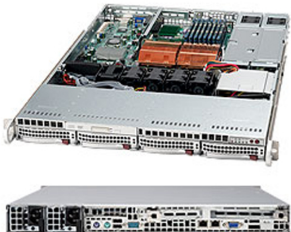
Фото Корпус SuperMicro CSE-815TQ-R650B

Отправьте запрос на коммерческое предложение SUPERMICRO и получите индивидуальные цены и сроки поставки. Серверы 1u, 2u, рабочие станции, системы хранения данных, серверные платформы, GPU-системы, BigTwin, SuperBlade