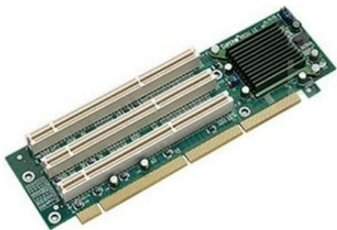
Фото Плата управления сервером SuperMicro CSE-PTJBOD-CB2

Отправьте запрос на коммерческое предложение SUPERMICRO и получите индивидуальные цены и сроки поставки. Серверы 1u, 2u, рабочие станции, системы хранения данных, серверные платформы, GPU-системы, BigTwin, SuperBlade