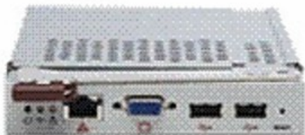
Фото SuperMicro SBM-CMM-001

Тел: +7 499 110-81-61 | Email: sale@supermicro-russia.ru | https://supermicro-russia.ru