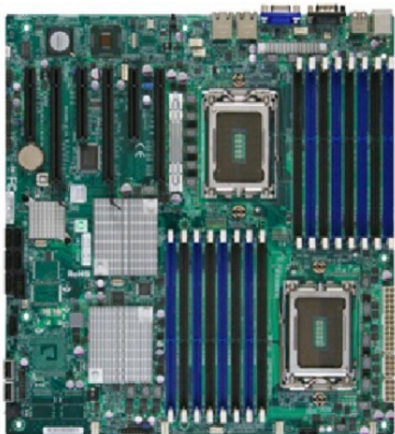
Фото Материнская плата SuperMicro MBD-H8DGI-F-O

Отправьте запрос на коммерческое предложение SUPERMICRO и получите индивидуальные цены и сроки поставки. Серверы 1u, 2u, рабочие станции, системы хранения данных, серверные платформы, GPU-системы, BigTwin, SuperBlade