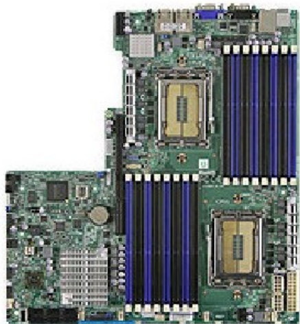
Фото Материнская плата SuperMicro MBD-H8DGU-F-B

Отправьте запрос на коммерческое предложение SUPERMICRO и получите индивидуальные цены и сроки поставки. Серверы 1u, 2u, рабочие станции, системы хранения данных, серверные платформы, GPU-системы, BigTwin, SuperBlade