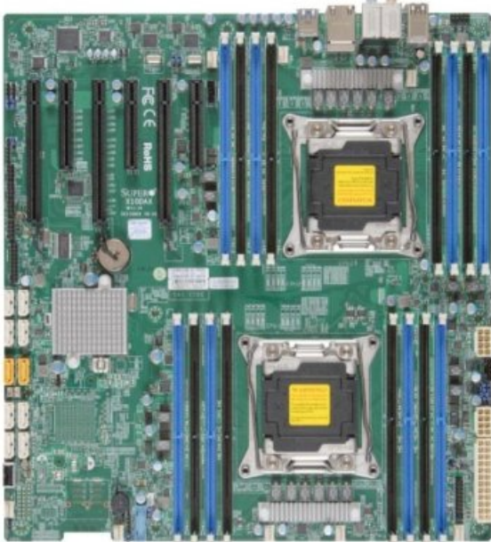
Фото Материнская плата SuperMicro MBD-X10DAX-O

Отправьте запрос на коммерческое предложение SUPERMICRO и получите индивидуальные цены и сроки поставки. Серверы 1u, 2u, рабочие станции, системы хранения данных, серверные платформы, GPU-системы, BigTwin, SuperBlade