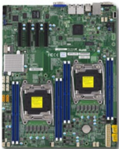
Фото Материнская плата SuperMicro MBD-X10DRD-I-O

Отправьте запрос на коммерческое предложение SUPERMICRO и получите индивидуальные цены и сроки поставки. Серверы 1u, 2u, рабочие станции, системы хранения данных, серверные платформы, GPU-системы, BigTwin, SuperBlade