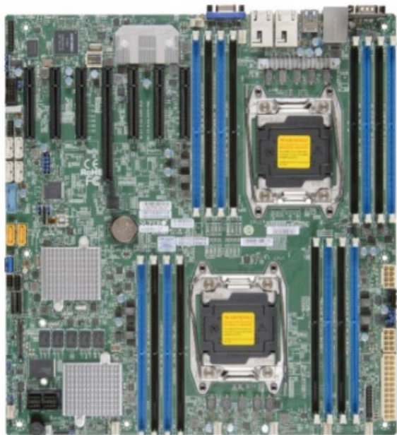
Фото Материнская плата SuperMicro MBD-X10DRH-I-O

Отправьте запрос на коммерческое предложение SUPERMICRO и получите индивидуальные цены и сроки поставки. Серверы 1u, 2u, рабочие станции, системы хранения данных, серверные платформы, GPU-системы, BigTwin, SuperBlade