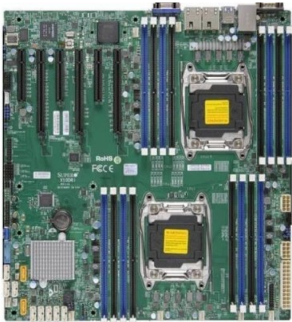
Фото Материнская плата SuperMicro MBD-X10DRI-B

Отправьте запрос на коммерческое предложение SUPERMICRO и получите индивидуальные цены и сроки поставки. Серверы 1u, 2u, рабочие станции, системы хранения данных, серверные платформы, GPU-системы, BigTwin, SuperBlade