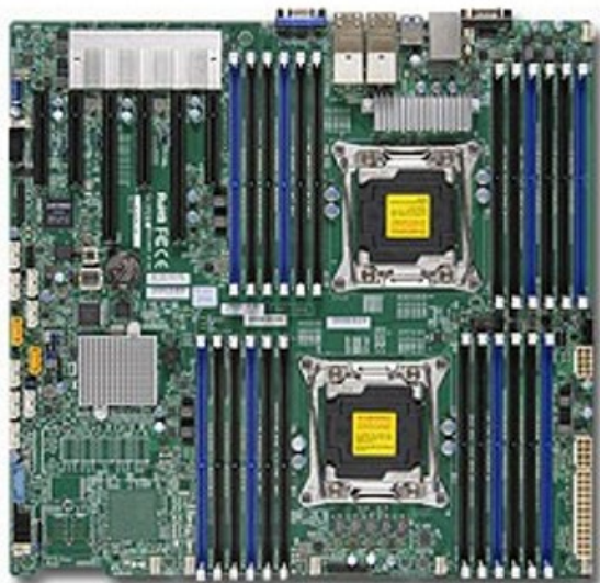
Фото Материнская плата SuperMicro MBD-X10DRI-T4+-O

Отправьте запрос на коммерческое предложение SUPERMICRO и получите индивидуальные цены и сроки поставки. Серверы 1u, 2u, рабочие станции, системы хранения данных, серверные платформы, GPU-системы, BigTwin, SuperBlade