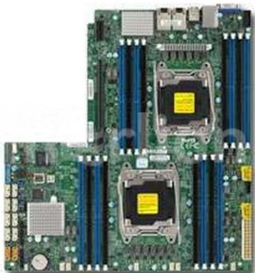
Фото Материнская плата SuperMicro MBD-X10DRW-ET-O

Отправьте запрос на коммерческое предложение SUPERMICRO и получите индивидуальные цены и сроки поставки. Серверы 1u, 2u, рабочие станции, системы хранения данных, серверные платформы, GPU-системы, BigTwin, SuperBlade