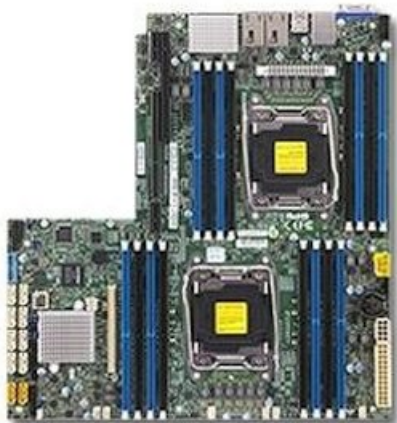
Фото Материнская плата SuperMicro MBD-X10DRW-I-B

Отправьте запрос на коммерческое предложение SUPERMICRO и получите индивидуальные цены и сроки поставки. Серверы 1u, 2u, рабочие станции, системы хранения данных, серверные платформы, GPU-системы, BigTwin, SuperBlade