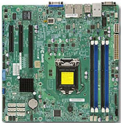
Фото Материнская плата SuperMicro MBD-X10SLM+-F-B

Отправьте запрос на коммерческое предложение SUPERMICRO и получите индивидуальные цены и сроки поставки. Серверы 1u, 2u, рабочие станции, системы хранения данных, серверные платформы, GPU-системы, BigTwin, SuperBlade