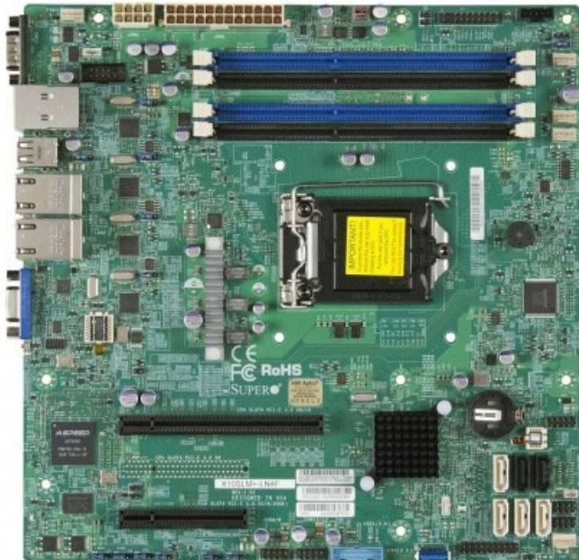
Фото Материнская плата SuperMicro MBD-X10SLM+-LN4F-O

Отправьте запрос на коммерческое предложение SUPERMICRO и получите индивидуальные цены и сроки поставки. Серверы 1u, 2u, рабочие станции, системы хранения данных, серверные платформы, GPU-системы, BigTwin, SuperBlade