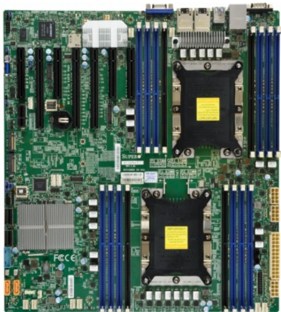
Фото Материнская плата SuperMicro MBD-X11DPH-TQ-O

Отправьте запрос на коммерческое предложение SUPERMICRO и получите индивидуальные цены и сроки поставки. Серверы 1u, 2u, рабочие станции, системы хранения данных, серверные платформы, GPU-системы, BigTwin, SuperBlade