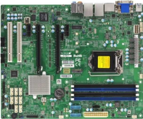
Фото Материнская плата SuperMicro MBD-X11SAE-F

Отправьте запрос на коммерческое предложение SUPERMICRO и получите индивидуальные цены и сроки поставки. Серверы 1u, 2u, рабочие станции, системы хранения данных, серверные платформы, GPU-системы, BigTwin, SuperBlade