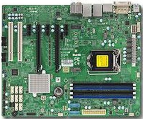
Фото Материнская плата SuperMicro MBD-X11SAE-O

Отправьте запрос на коммерческое предложение SUPERMICRO и получите индивидуальные цены и сроки поставки. Серверы 1u, 2u, рабочие станции, системы хранения данных, серверные платформы, GPU-системы, BigTwin, SuperBlade