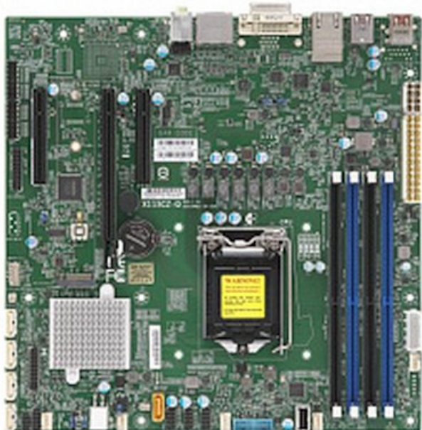
Фото Материнская плата SuperMicro MBD-X11SCZ-Q-B

Отправьте запрос на коммерческое предложение SUPERMICRO и получите индивидуальные цены и сроки поставки. Серверы 1u, 2u, рабочие станции, системы хранения данных, серверные платформы, GPU-системы, BigTwin, SuperBlade