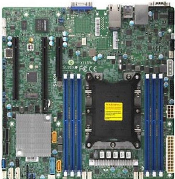
Фото Материнская плата SuperMicro MBD-X11SPM-F-O

Отправьте запрос на коммерческое предложение SUPERMICRO и получите индивидуальные цены и сроки поставки. Серверы 1u, 2u, рабочие станции, системы хранения данных, серверные платформы, GPU-системы, BigTwin, SuperBlade