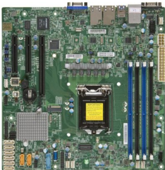
Фото Материнская плата SuperMicro MBD-X11SSH-F-B

Отправьте запрос на коммерческое предложение SUPERMICRO и получите индивидуальные цены и сроки поставки. Серверы 1u, 2u, рабочие станции, системы хранения данных, серверные платформы, GPU-системы, BigTwin, SuperBlade