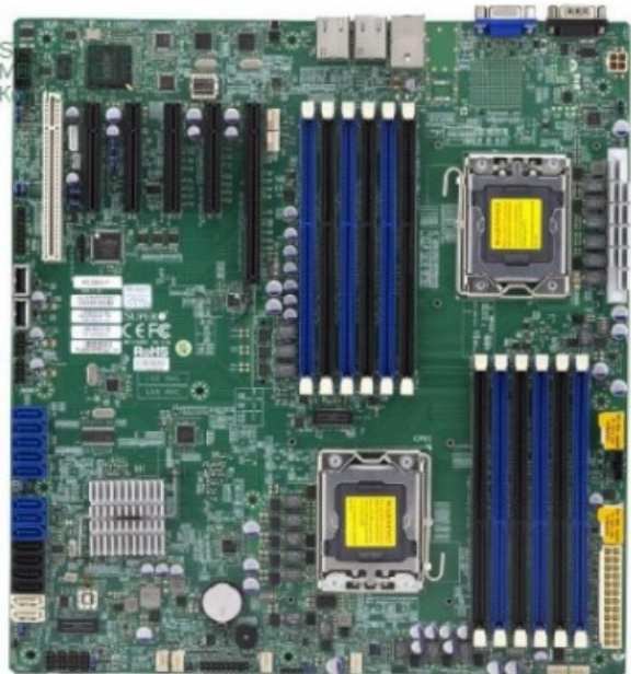
Фото Материнская плата SuperMicro MBD-X9DBI-F-O

Отправьте запрос на коммерческое предложение SUPERMICRO и получите индивидуальные цены и сроки поставки. Серверы 1u, 2u, рабочие станции, системы хранения данных, серверные платформы, GPU-системы, BigTwin, SuperBlade