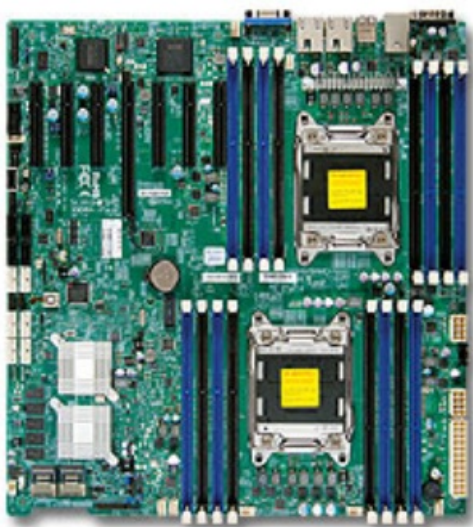
Фото Материнская плата SuperMicro MBD-X9DRH-7F-B

Отправьте запрос на коммерческое предложение SUPERMICRO и получите индивидуальные цены и сроки поставки. Серверы 1u, 2u, рабочие станции, системы хранения данных, серверные платформы, GPU-системы, BigTwin, SuperBlade