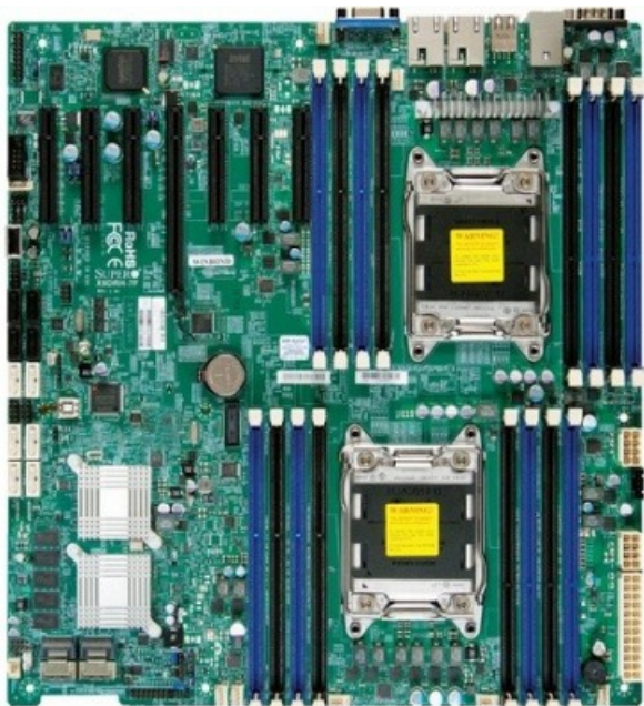
Фото Материнская плата SuperMicro MBD-X9DRH-IF-B

Отправьте запрос на коммерческое предложение SUPERMICRO и получите индивидуальные цены и сроки поставки. Серверы 1u, 2u, рабочие станции, системы хранения данных, серверные платформы, GPU-системы, BigTwin, SuperBlade