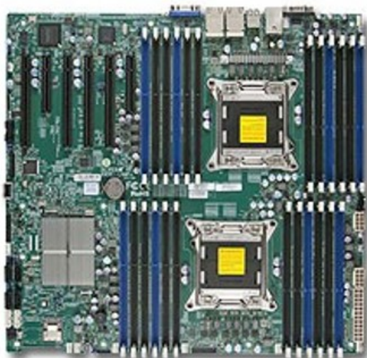
Фото Материнская плата SuperMicro MBD-X9DRI-LN4F+-B

Отправьте запрос на коммерческое предложение SUPERMICRO и получите индивидуальные цены и сроки поставки. Серверы 1u, 2u, рабочие станции, системы хранения данных, серверные платформы, GPU-системы, BigTwin, SuperBlade