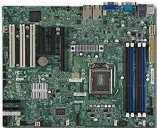
Фото Материнская плата SuperMicro MBD-X9SCE-F-B

Отправьте запрос на коммерческое предложение SUPERMICRO и получите индивидуальные цены и сроки поставки. Серверы 1u, 2u, рабочие станции, системы хранения данных, серверные платформы, GPU-системы, BigTwin, SuperBlade