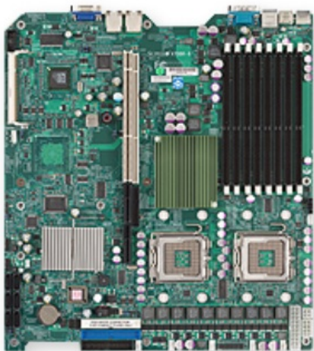
Фото Материнская плата SuperMicro MBD-X7DBR-i-B

Отправьте запрос на коммерческое предложение SUPERMICRO и получите индивидуальные цены и сроки поставки. Серверы 1u, 2u, рабочие станции, системы хранения данных, серверные платформы, GPU-системы, BigTwin, SuperBlade