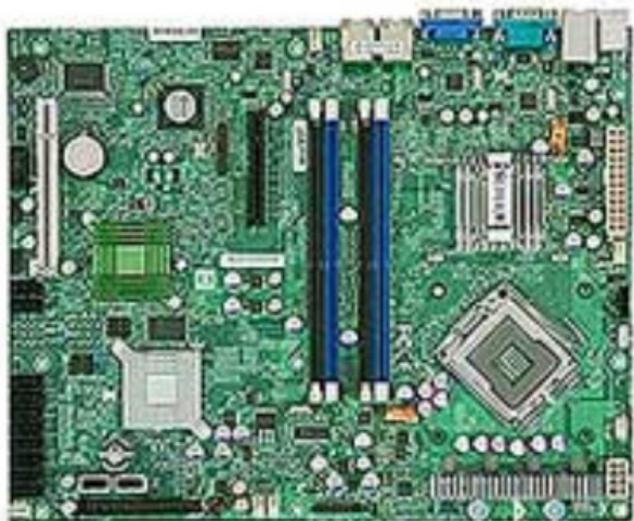
Фото Материнская плата Supermicro MBD-X7SB3-O

Отправьте запрос на коммерческое предложение SUPERMICRO и получите индивидуальные цены и сроки поставки. Серверы 1u, 2u, рабочие станции, системы хранения данных, серверные платформы, GPU-системы, BigTwin, SuperBlade