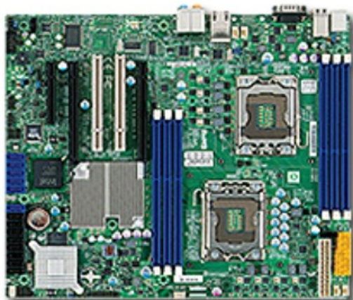
Фото Материнская плата SuperMicro MBD-X8DAL-3-B

Отправьте запрос на коммерческое предложение SUPERMICRO и получите индивидуальные цены и сроки поставки. Серверы 1u, 2u, рабочие станции, системы хранения данных, серверные платформы, GPU-системы, BigTwin, SuperBlade