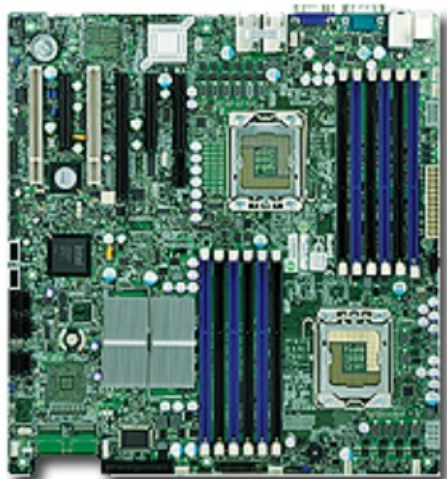
Фото Материнская плата SuperMicro MBD-X8DTI-O

Отправьте запрос на коммерческое предложение SUPERMICRO и получите индивидуальные цены и сроки поставки. Серверы 1u, 2u, рабочие станции, системы хранения данных, серверные платформы, GPU-системы, BigTwin, SuperBlade