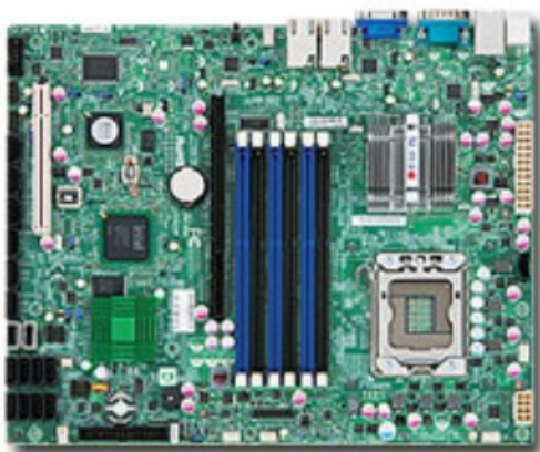
Фото Материнская плата SuperMicro MBD-X8STI-F-O

Отправьте запрос на коммерческое предложение SUPERMICRO и получите индивидуальные цены и сроки поставки. Серверы 1u, 2u, рабочие станции, системы хранения данных, серверные платформы, GPU-системы, BigTwin, SuperBlade