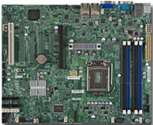
Фото Материнская плата SuperMicro MBD-X9SCI-LN4F-B

Отправьте запрос на коммерческое предложение SUPERMICRO и получите индивидуальные цены и сроки поставки. Серверы 1u, 2u, рабочие станции, системы хранения данных, серверные платформы, GPU-системы, BigTwin, SuperBlade