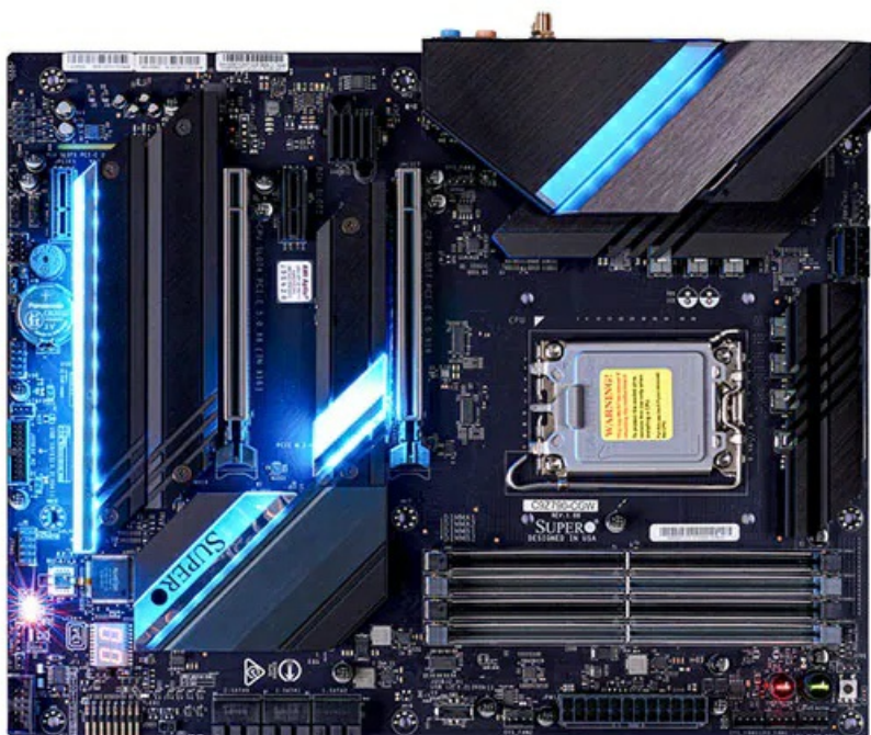
Фото Материнская плата C9Z790-CGW Supermicro MBD-C9Z790-CGW

Отправьте запрос на коммерческое предложение SUPERMICRO и получите индивидуальные цены и сроки поставки. Серверы 1u, 2u, рабочие станции, системы хранения данных, серверные платформы, GPU-системы, BigTwin, SuperBlade