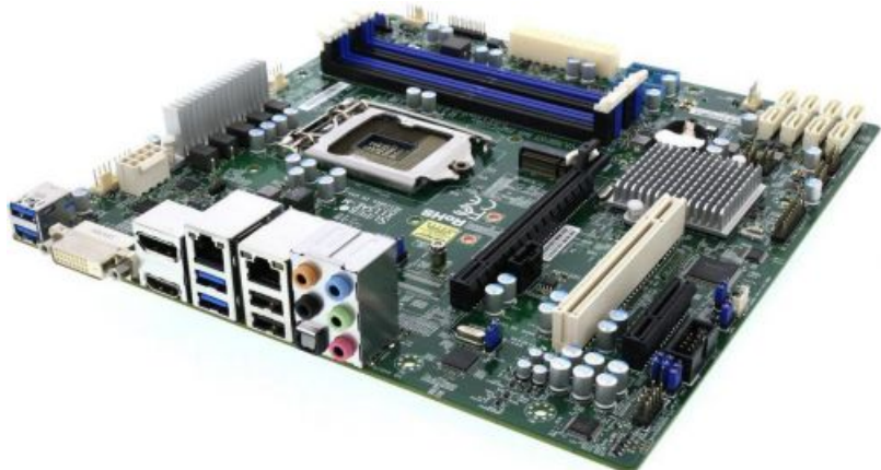
Фото Материнская плата Supermicro MBD-X11SAE-M-O

Тел: +7 499 110-81-61 | Email: sale@supermicro-russia.ru | https://supermicro-russia.ru