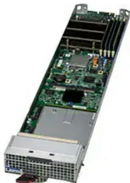
(Angled View – Blade Server)