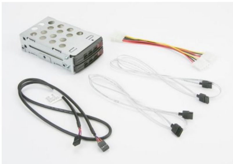
Фото Supermicro MCP-220-82616-0N - корзина hot-swap для 2 x 2.5" накопителей

Отправьте запрос на коммерческое предложение SUPERMICRO и получите индивидуальные цены и сроки поставки. Серверы 1u, 2u, рабочие станции, системы хранения данных, серверные платформы, GPU-системы, BigTwin, SuperBlade