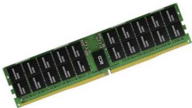
Фото Оперативная память SuperMicro M321R4GA3BB6-CQK_SM

Отправьте запрос на коммерческое предложение SUPERMICRO и получите индивидуальные цены и сроки поставки. Серверы 1u, 2u, рабочие станции, системы хранения данных, серверные платформы, GPU-системы, BigTwin, SuperBlade