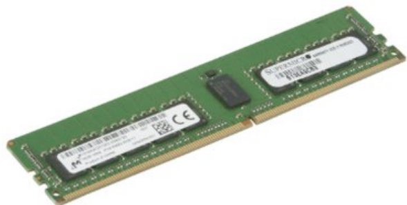
Фото Оперативная память SuperMicro MEM-DR416L-CL06-ER26

Отправьте запрос на коммерческое предложение SUPERMICRO и получите индивидуальные цены и сроки поставки. Серверы 1u, 2u, рабочие станции, системы хранения данных, серверные платформы, GPU-системы, BigTwin, SuperBlade