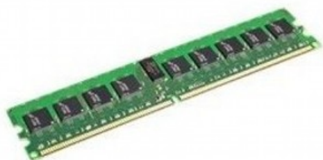
Фото Оперативная память SuperMicro MEM-DR432L-SL01-LR21 32 ГБ DDR4 ECC Reg 2133 МГц

Отправьте запрос на коммерческое предложение SUPERMICRO и получите индивидуальные цены и сроки поставки. Серверы 1u, 2u, рабочие станции, системы хранения данных, серверные платформы, GPU-системы, BigTwin, SuperBlade