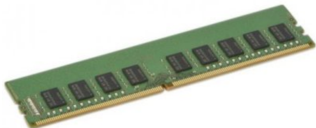
Фото Оперативная память SuperMicro MEM-DR480L-SL01-EU21

Отправьте запрос на коммерческое предложение SUPERMICRO и получите индивидуальные цены и сроки поставки. Серверы 1u, 2u, рабочие станции, системы хранения данных, серверные платформы, GPU-системы, BigTwin, SuperBlade