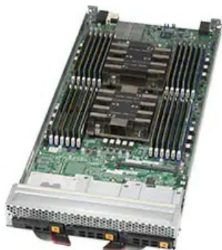
Фото Платформа Blade Supermicro SBI-6129P-T3N

Тел: +7 499 110-81-61 | Email: sale@supermicro-russia.ru | https://supermicro-russia.ru